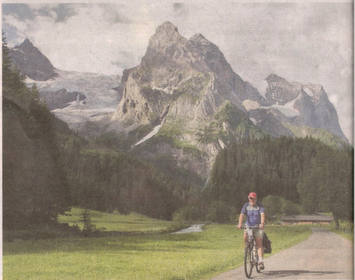
Mit dem Elektro-Rad wird die Tour durch die Berge auch für weniger trainierte Radler möglich.

land geht. Konkret organisiert u. a. die Mosel-Tour durch das Moseltal. In Deutschland geht es zum Beispiel durch die Mosel-Tour durch das Moseltal. In Frankreich geht es zum Beispiel durch das Berner Ober-